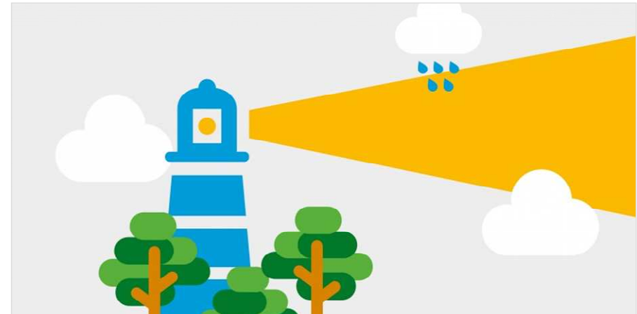
Bild: Klimalotse (Kompetenzzentrum Klimafolgen und Anpassung - KomPass)

Tatenbank → Beispiele für Anpassungsmaßnahmen kennenlernen und Anregungen von anderen Akteuren für eigene Umsetzung erhalten