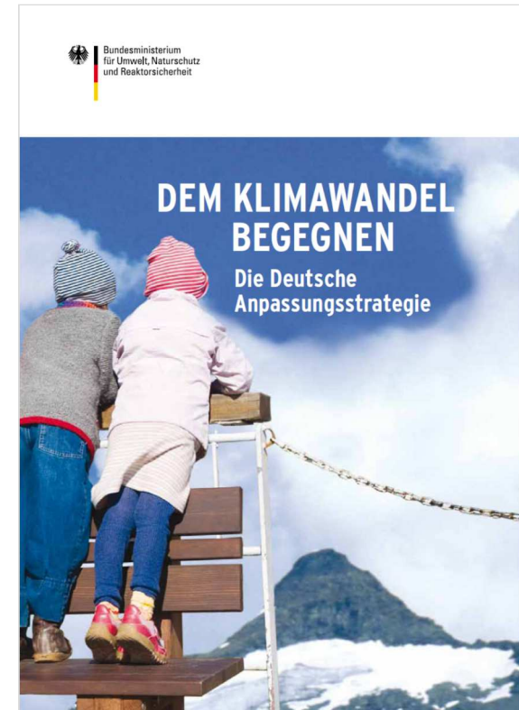
Broschüre des BMUB zur Deutschen Anpassungsstrategie